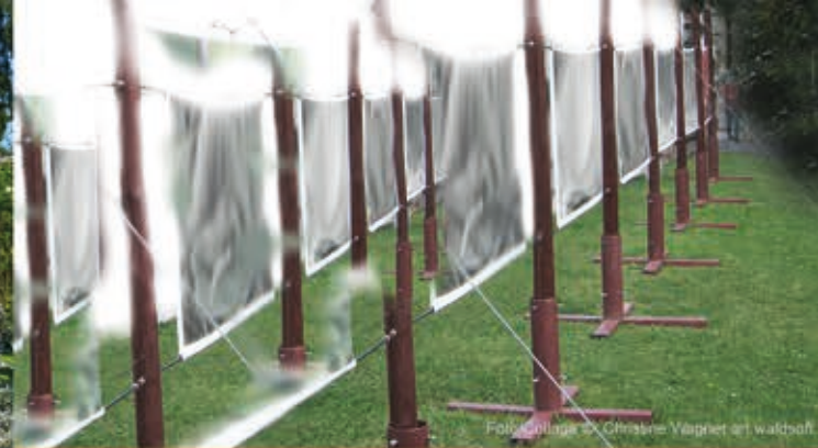
Folkcollage © Christine Wagner art.waldhaft