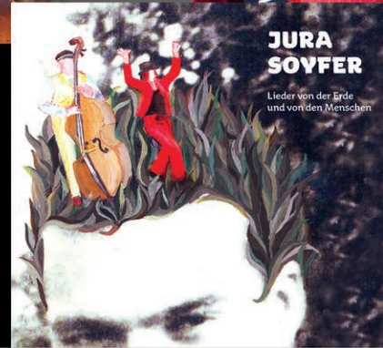
CD Cover © Judith Holly

Freitag, 26. August 2016, 19:30 Uhr Rathaussaal, Rathausplatz 1, 3970 Weitra