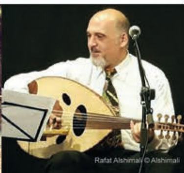
Rafat Alshimali