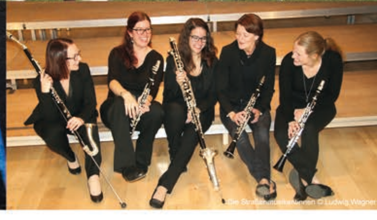
Die Straßenmusikantinnen

Samstag, 17. September 2016, 14:00 Uhr Fretzenschlag 26, 3920 Groß Gerungs