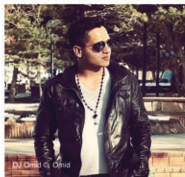
DJ Omid