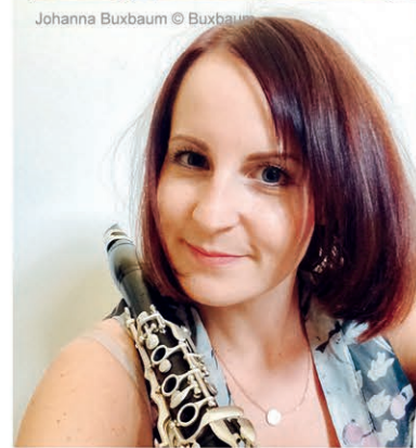
Johanna Buxbaum